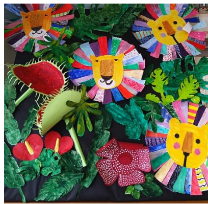
ジャンジャンジャンコー