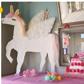
ペガサスファンタジー

創作活動で出来上がった作品たちはワークの階段や玄関に飾られています。見学などで来られた方に観てもらったり、利用者さんの目を楽しませてくれたりしています。機会があればぜひ観に来て下さいね。来られない方は、まつのみのインスタやホームページ【 matsunomi.com 】にアップしていますのでご覧いただければ嬉しいです。 また、「大阪生活サポート協会」へ作品を送って協会ホームページや作品展示会で発表もしています。これまでに賞をいただき、表彰式に参加したこともあるんですよ。はり絵や習字、絵や立体創作物など個性的な作品もたくさんあって、利用者の方によっては日に日に表現が豊かになってきているのを感じています。