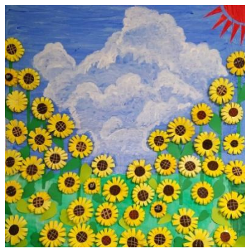
ひまひまひまわり